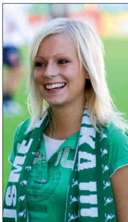
Loňská Miss Kenguru