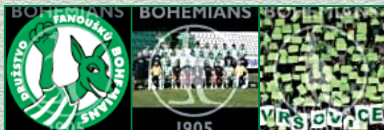
44461 Logo DBF černé