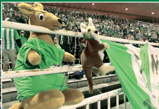
FC Hradec Králové – Bohemians 1905