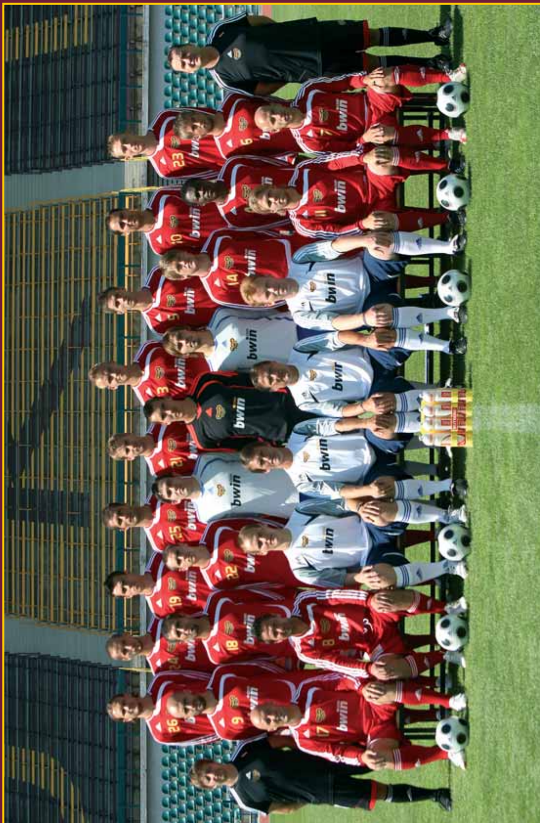
FK DUKLA PRAHA